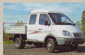
GAZ-Pritsche mit Langkabine