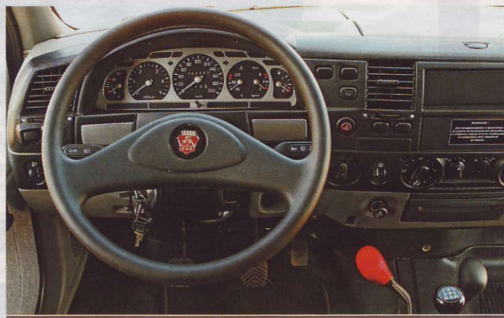
Prima: die Geländeuntersetzung (rot) ist ohne Zentralsperre nutzbar

Die Fahreigenschaften haben mit dem geschmeidigen Wildtier, das dem rauen Russen den Namen lieh, nicht direkt etwas zu tun: Willig, aber nicht richtig schnell setzt er sich in Bewegung, der nur milde aufgeladene Motor hat kein merkliches Turboloch. Überrascht nimmt man die akzeptable Federung zur Kenntnis, stimmruhend die gefühllose Servolenkung und die ABS-losen Bremsen. Im Gelände kommt man dafür – auch dank der grobstolligen Reifen – prächtig voran. [T. Rönneberg]